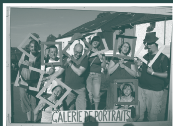
Extrait d'un Musée de la Vie Quotidienne

Ils proposeront des prises de vue dans des décors improbables, avec des accessoires "sourires", "moustaches" et autres gadgets de leur création ! Tous ces clichés, de nous, de vous, composeront ce fameux MVQ !