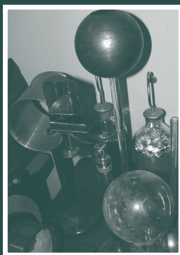
Instruments de physique

Ce deuxième parcours amènera les visiteurs jusqu'au musée temporaire installé dans le hall du Forum Louis Lareng. La tente Patrimoine abritera l'exposition photographique "Sur les traces d'Henri Gaussen, l'évolution du paysage pyrénéen" ainsi qu'une exposition "Botanique et Médecine" et quelques planches pédagogiques. Le musée temporaire réunira des instruments de physique, des planches d'herbiers, des ossements, des fossiles, issus des collections, des petites plantes rappelant le jardin botanique ainsi que des instruments de l'Observatoire Midi-Pyrénées.