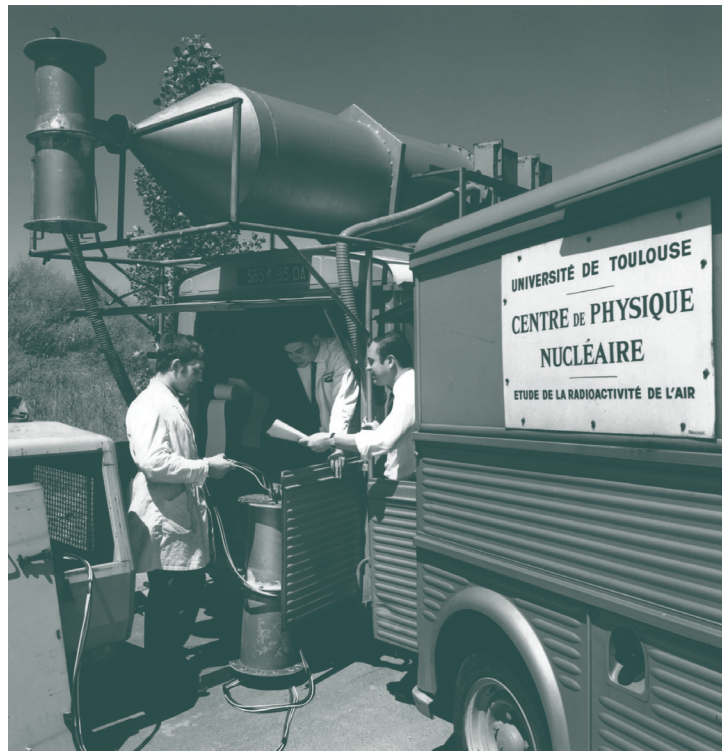
Laboratoire ambulant de Physique nucléaire faisant un prélèvement en campagne. Juillet 1967 Exposition de photographies de Jean DIEUZAIDE - "1963-1967, l'Université Paul Sabatier prend vie".

Bâtiment administratif central 118, rte de Narbonne 31062 Toulouse cedex 9 Tél. : 05 61 55 82 60 culture@adm.ups-tlse.fr