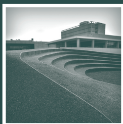
Le Fil d'Ariane de Philolaos

Flux de Joël Feset et l'architecture de la nouvelle BU Sciences.