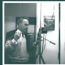
Jean DIEUZAIDE - Prise de vue sur le campus - 1967

Son œil sera le vôtre pour cette visite très années 60.