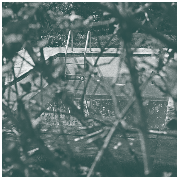
Exposition de photographies "Etat des lieux d'un territoire qui change" - Atelier interuniversitaire de création photographique encadré par Yohann Gozard.