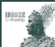
Iphaze - Album Worship