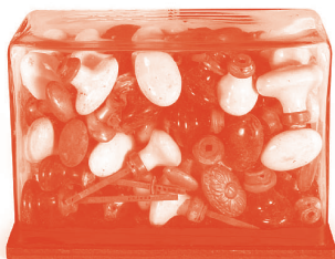
"TANTO TIENE, TANTO VALE" - Arman - 1960

Le Service Culture fait entrer l'Histoire de l'Art des XX e et XXI e siècles à l'Université Paul Sabatier. En écho à la programmation des expositions organisées dans les musées et les Centres d'art, à Paris et à Toulouse, étudiants et personnels de l'université se retrouveront une fois par mois pour découvrir ou se remémorer les œuvres, le contexte historique et le parcours des artistes mis à l'honneur.