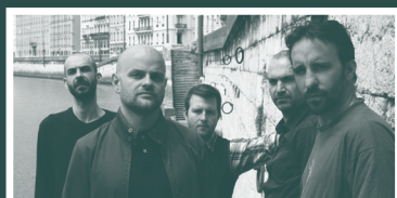
Kaly Live Dub

Entrée libre dans la limite des places disponibles.