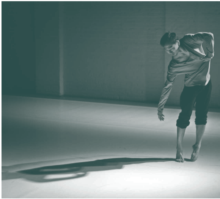
Shang-Chi Sun, danseur chorégraphe taiwanais - Salle Le CAP dans le cadre du Festival Made In Asia - 26 janvier 2012