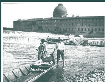
Pêcheurs à l'écuelle au Bazacle (Toulouse), vers 1880

du 1 er avril au 6 mai 2011 Hall du Forum Louis Lareng Université Paul Sabatier 118 route de Narbonne Entrée libre.