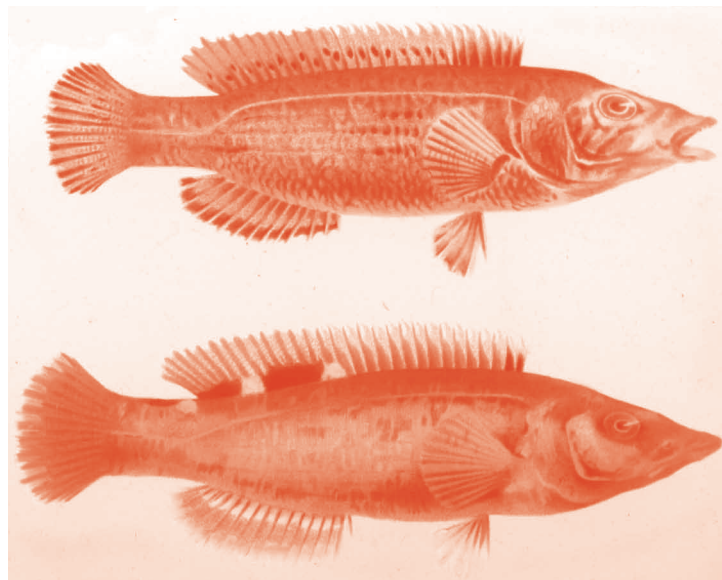
Exposition "Mémoire de poissons" - Hall du Forum Louis Lareng - Avril 2011