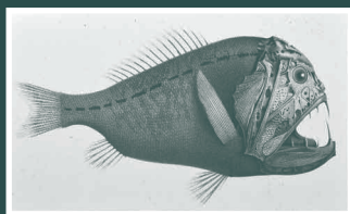
Amalgopterus ornata (Pellegrin, 1933)

Une exposition de saison, au cœur de notre histoire scientifique.