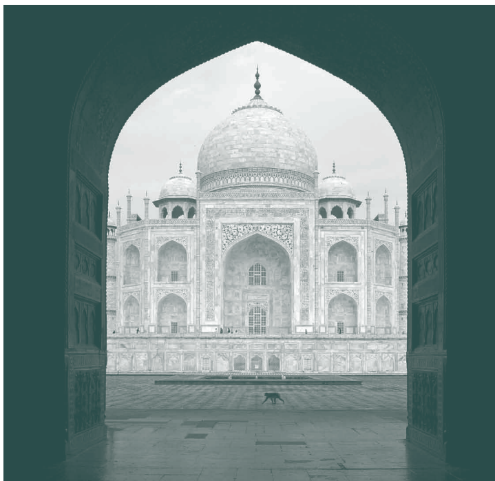
Exposition “Les couleurs de l'Inde” - Hall du Forum Louis Lareng - Mai-juin 2011