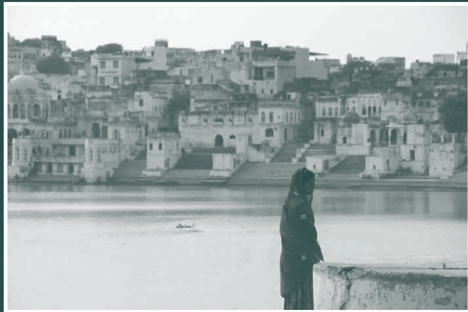
Pushkar, Rajasthan.

Ces photographies de Sébastien Chastanet, photographe amateur, sont une véritable invitation au voyage, dans une Inde du Nord, pleine de mystères et de saveurs.