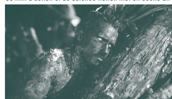
Predator de John McTiernan (1987)

Ce film d'action et de science-fiction met en scène un