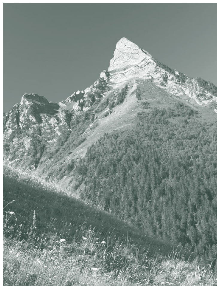
“Sur les traces de Henri Gaussen”. Exposition de photos sur l'évolution du paysage pyrénéen.

Vous trouverez le programme complet de ces rencontres au Service Culture de l'Université Paul Sabatier (à compter de la mi-novembre).