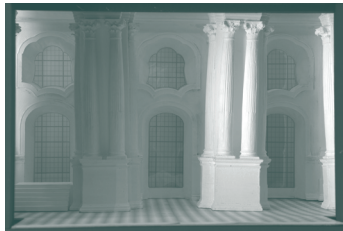
Maquette du décor créé par Ezio Frignolo pour l'opéra Le chevalier à la rose - Théâtre du Capitole - 2008.

Le Service Culture de l'Université, propose aux étudiants de poursuivre leur découverte des coulisses de la Maison d'Opéra, en partenariat avec le Service Educatif du Théâtre du Capitole.