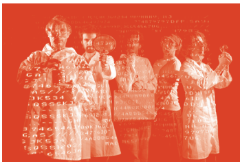
Sayag Jazz Machine

Mercredi 29 avril 2009, à 20h30 Salle Le CAP Entrée 5 euros.