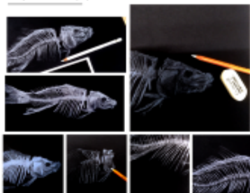
SQUELETTE DE CARPE Crayon blanc sur papier noir.

En 2024, le Pôle culture a pu proposer à la communauté étudiante une vingtaine d'ateliers de pratiques artistiques sur chacun des semestres, se déroulant en semaine, en fin de journée, de 18h00 à 20h00, dans des salles de cours de la Maison de la Réussite en Licence. Des nouvelles disciplines ont eu beaucoup de succès comme une nouvelle approche de la photographie et du portrait. Afin de diversifier l'offre et de pallier au peu de temps disponible sur un planning étudiant en semaine, le format « stage » s'est enrichi de nouvelles propositions. Ce format, d'une journée ou une demi-journée, en week-end, permet de reconduire des sujets très demandés comme le dessin d'art (modèle vivant), la linogravure et d'en découvrir de nouvelles comme les paperolles (ou technique du quilling), intégrées dans un week-end multi-crétions.