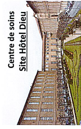
Centre de soins Site Hôtel Dieu