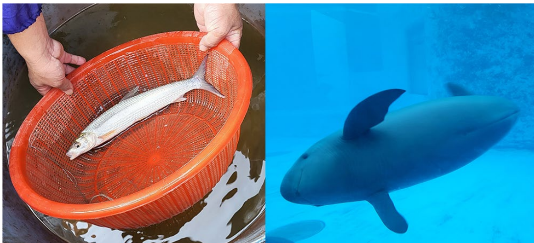
^ A gauche : le poisson tube, en danger critique d'extinction – le dernier stade avant l'extinction à l'état sauvage d'après l'Union internationale pour la conservation de la nature – a refait son apparition sur une dizaine des 57 sites étudiés. A droite : marsouin aptère à l'Institut hydrobiologique de Wuhan.