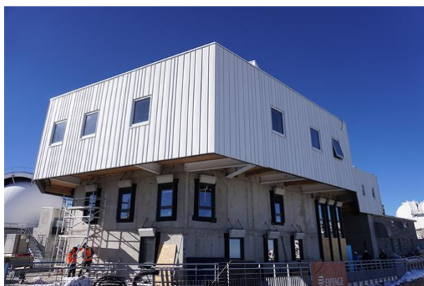
Le clos couvert de la structure "Dauzère-Soler"