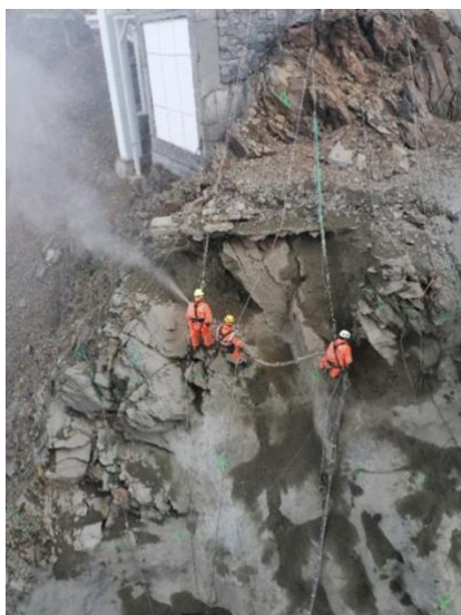
Travaux de renforcement de la falaise