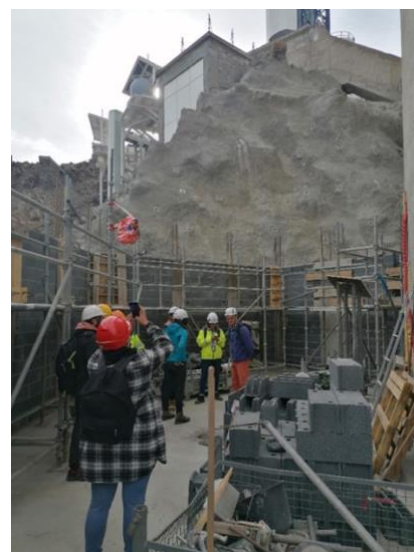
Travaux sur la structure du télescope Bernard Lyot.

Ces chantiers, qui ont pu être menés grâce au soutien du Contrat de plan État-région (CPER) 2015-2020, ont permis de renforcer la dynamique du site du pic du Midi de Bigorre portée par l'OMP, tout en respectant sa dimension architecturale originale. Avec ces extensions, le site augmente sa capacité d'accueil et d'hébergement scientifique de plus de 500 m 2 .